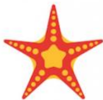
la estrella de mar