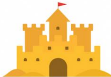
el castillo de arena