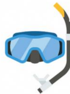
la máscara y el tubo de buceo