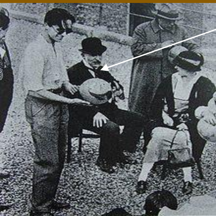
Prvé filmové štúdio štúdio v Hollywoode - Nestor Studios