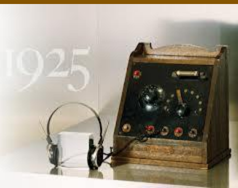
Jedno z prvých rádií

Prvý športový prenos z futbalového zápasu sa konal tak, že reportér z ihriska telefonoval do rozhlasu a hlásateľ po ňom opakoval vetu po vete