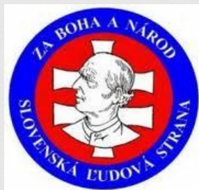
Slovenská republika (1939 – 1945)