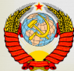
Znak Sovietskeho zväzu

Medzi ZSSR a Fínskym vypukla v roku 1939 tzv. zimná vojna ...po tuhých bojoch získali Soviety víťazstvo a Fínsko im muselo odstúpiť časť svojho územia - Karelská šija