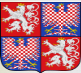
Znak Protektorátu Čechy a Morava